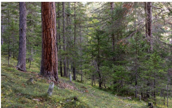
God avert cun bos-cha chi furnischa sems (tieus da god)