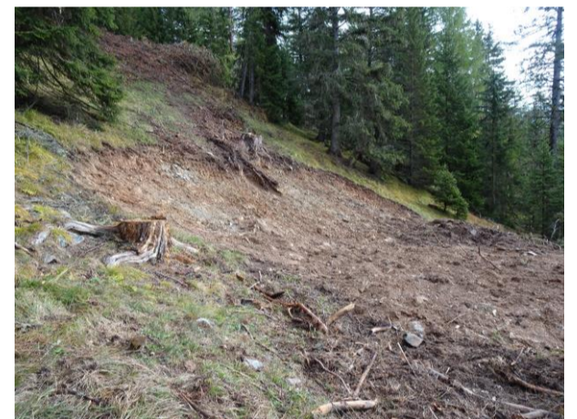
Terrain güsta sgraflà