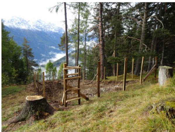
Saiv cun terrain sgraflà