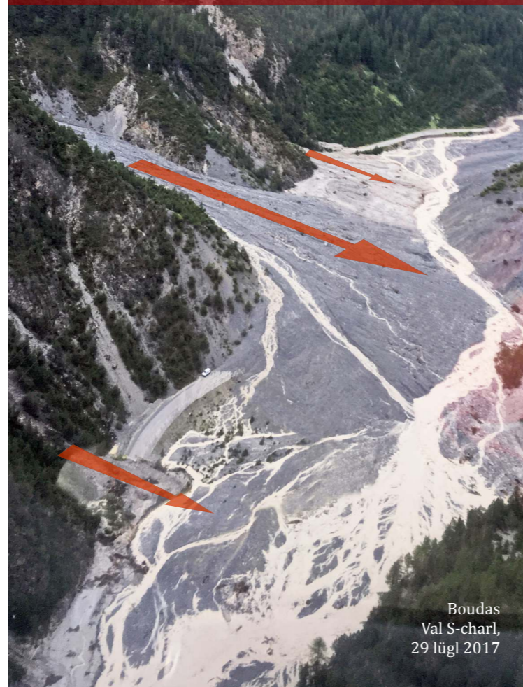
Boudas Val S-charl, 29 lügl 2017