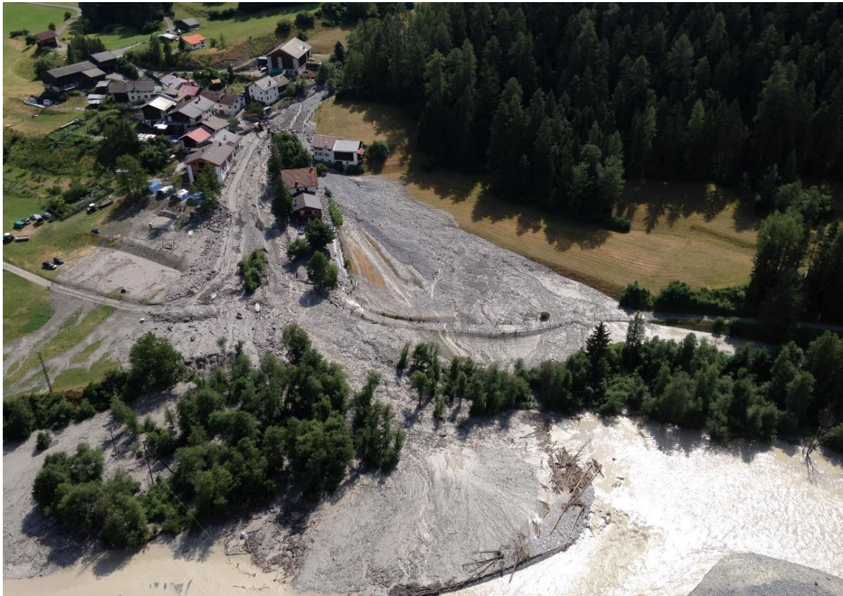
Illustraziun 1: Il cumünet da Pradella davo l'evenimaint dals 22 lügl 2015

Duos evenimaints da quist gener sun cuntschaints eir dal tschientiner passà, ün als 27 settember 1942, ün als 24 avuost 1944. Impustüt il seguond ha chaschunà gronds dons materials. Quistas bou-das han dat andit a la construcziun dal chanal e dad ulteriurs repairs pro l'aua da Triazza (1946/47 e 1956).