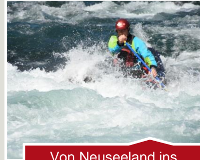
Von Neuseeland ins Wildwasserparadies Unterengadin