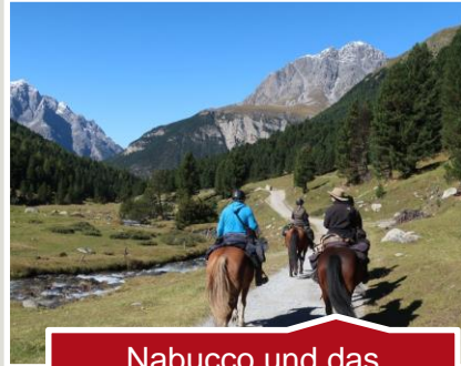
Nabucco und das Bärenfutter – Reittrekking im Engadin