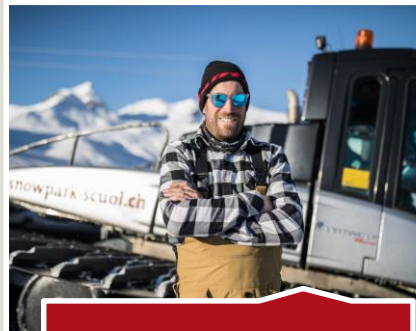
Herr der Schanzen und Boxen