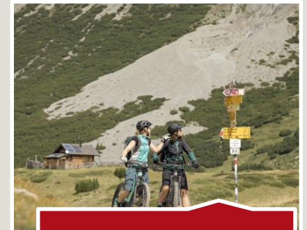
E-Bike-Tour um den Nationalpark