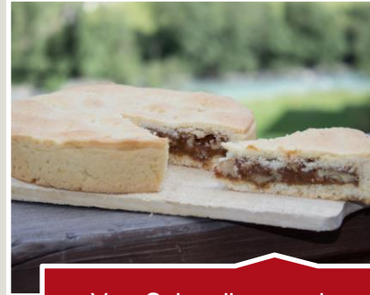
Von Schwalben und Auswanderern