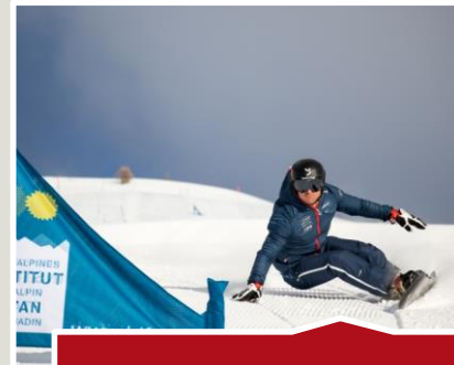
Mit dem Profisnowboarder unterwegs