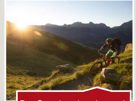
Der Snowboarder, der auch Mountainbiker ist