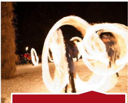
Hom Strom – es brennt!